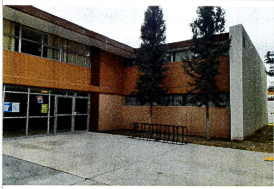
F1: Fachada principal